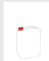
Kanister 10 l Art.-Nr.: 2000028